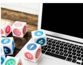
خدمات فضای مجازی