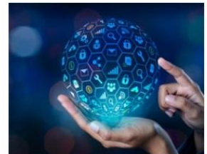
شبکه امنیت و سخت افزار