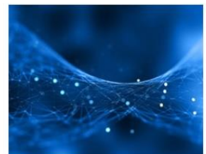
اطلاع رسانی و روابط عمومی