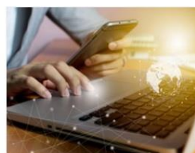
صندوقهای مکانیزه فروش