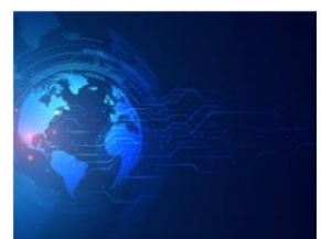
ارتباط و صنعت