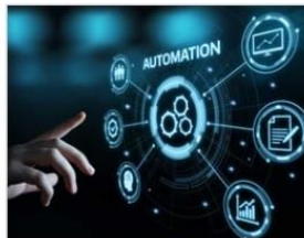
شبکه و اینترنت