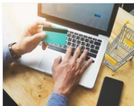
ارزشیابی و نظارت